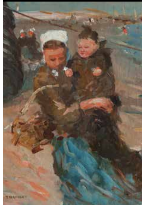
Eugène Flavien Trigoulet (Paris, 1864- Berck-sur-Mer, 1910) Matelote à l'enfant Coll. Musée Opale-Sud, Berck-sur-Mer

ADRESSE 60, rue de l'Impératrice 62600 Berck-sur-Mer