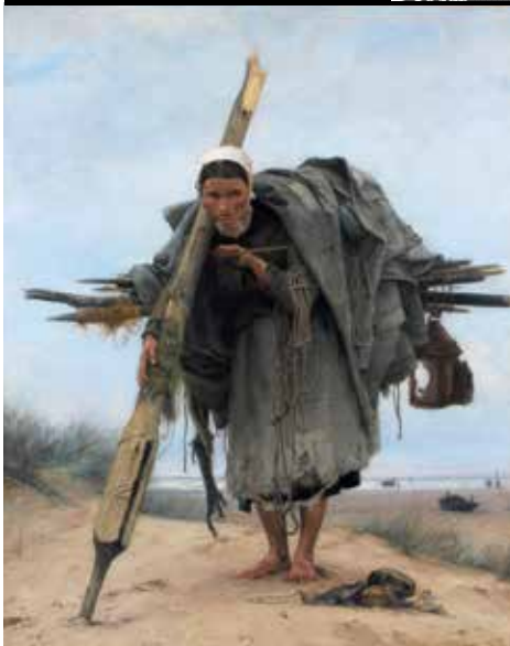
Francis Tattegrain - La ramasseuse aux épaves musée de Boulogne-sur-Mer