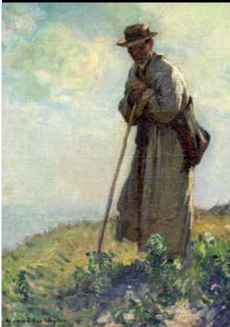
Van der Weyden Harry, Berger dans la dune , huile sur carton, collection musée de France Roger Rodière