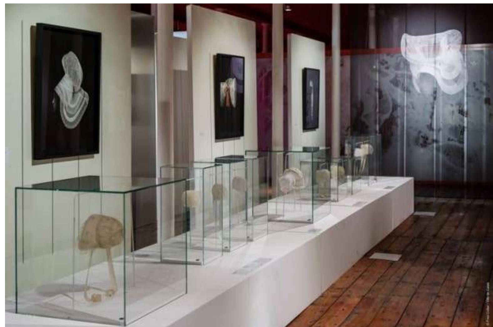
© Accrochage Apparitions Photo F. CollierMusée de la Dentelle