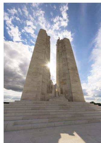
Mémorial de Vimy

Parc Mémorial Canadien ; chemin des Canadiens, Vimy