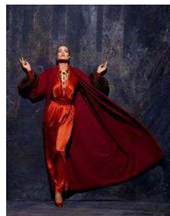
Hubert de Givenchy, ensemble du soir, hiver 1991