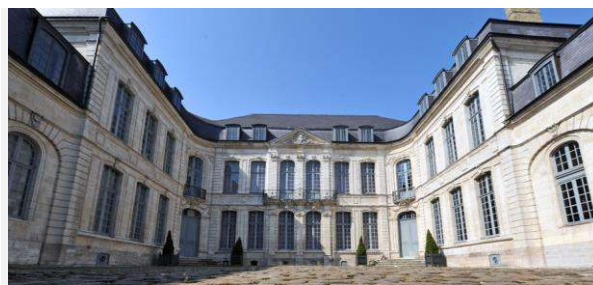
Musée de l'hôtel Sandelin

Du 24 mai au 30 août 2017, le Musée de l'hôtel Sandelin de Saint-Omer proposera au public une exposition exceptionnelle en partenariat avec le musée du Louvre et en particulier le musée national Eugène-Delacroix. A travers près de 80 œuvres d'artistes appartenant au mouvement romantique, plongez dans un imaginaire collectif construit par ces peintres,