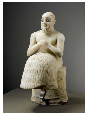
Tell Hariri (ancienne Mari, Syrie actuelle) Vers 2400 avant J.-C.