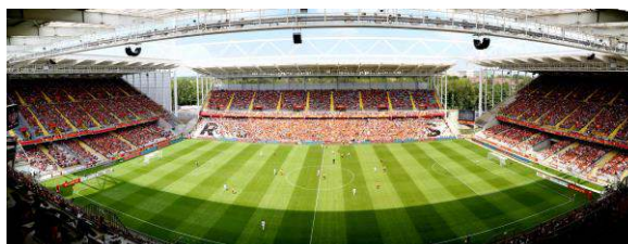
Louvre-Lens – Stade Bollaert